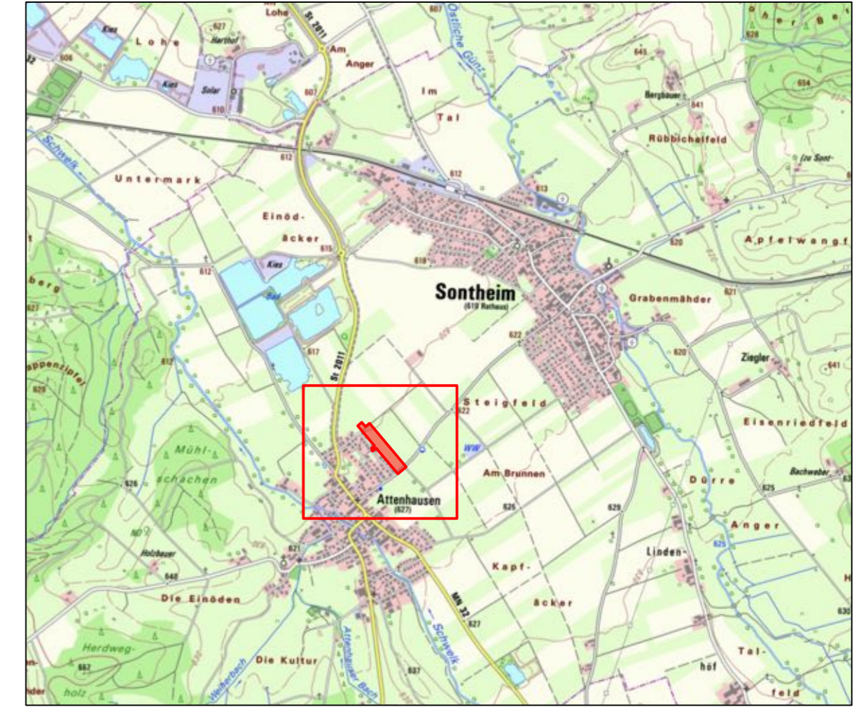
Übersichtslageplan ohne Maßstab

Mindelheim, den ..... Martin Eberle, Landschaftsarchitekt & Stadtplaner